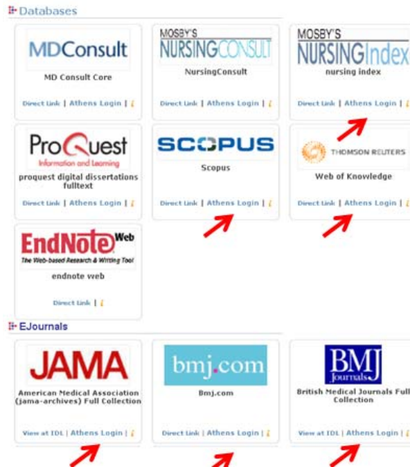
تصویر ۷- پیوند Athens Login زیر لوگو منابع الکترونیکی در INLM